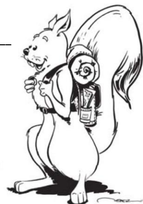
Mascotte dessinée par Alain WEBER