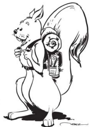
Mascotte dessinée par Alain WEBER